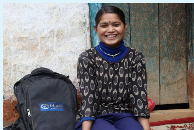
Bimu 夢想成為一名律師。

「人們現在可能對我有負面的看法，但我們這樣做理由充分。人們以後一定會意識到這是多麼的重要。」