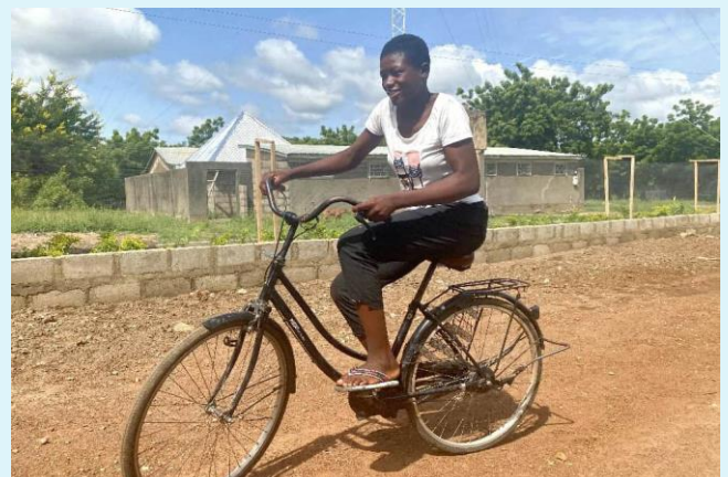
現在 Comfort 可以專注學業和夢想。

Comfort 說：「以往來經時，我經常不得不缺課在家，因我沒有足夠的衛生巾帶到學校使用，但現在有了月經杯，我不再需要向別人要錢來支持我的月經健康。」