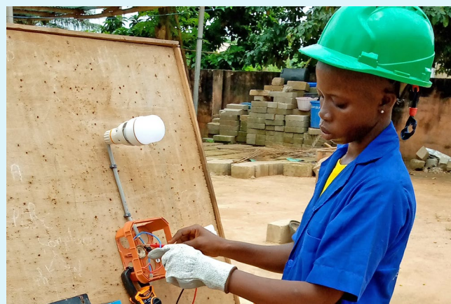
Charlotte 正走上經濟獨立的未來。

Charlotte 目前正在實習，以提高她對可再生能源的了解、制定現場估算和管理業務。憑著勇氣和毅力，她將機會化為經濟獨立的未來。