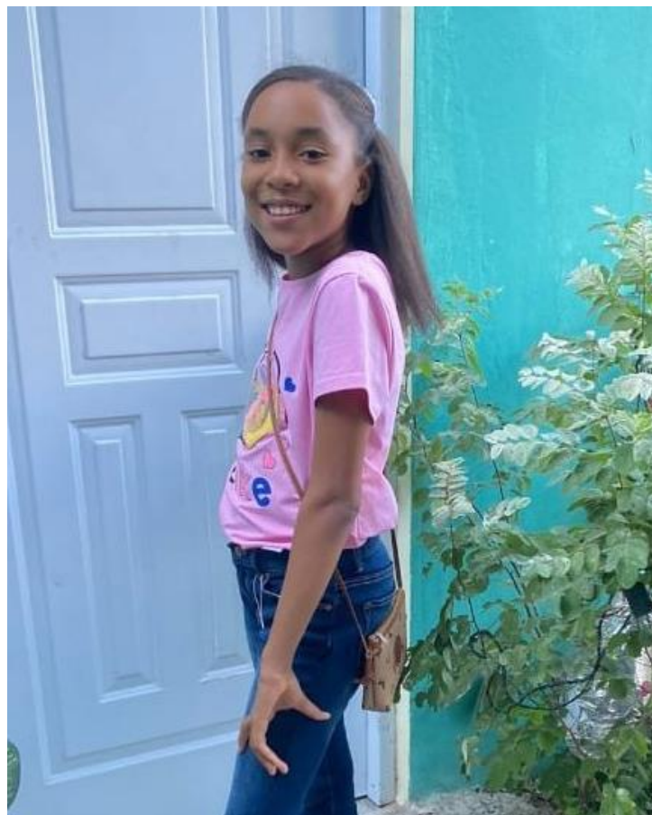
每一位被守護的孩子都是一個已改變的未來。

透過發展年輕婦女的技能和創業能力，我們協助他們獲得財務獨立。不僅為她們提供金錢上的支持，也提高了她們的自尊和自信。除此之外，我們還透過社區照護中心，培養五歲以下兒童的各種動作技能。許多這類由社區主導的計劃為南部地區的多明尼加人創造了更美好的未來。