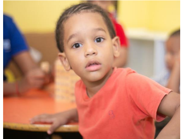
南部地區的孩子正因您而茁壯成長。

它還包括專為解決相關問題而設的單位，以確保涵蓋所有基本概念並將其融入家庭實踐中。