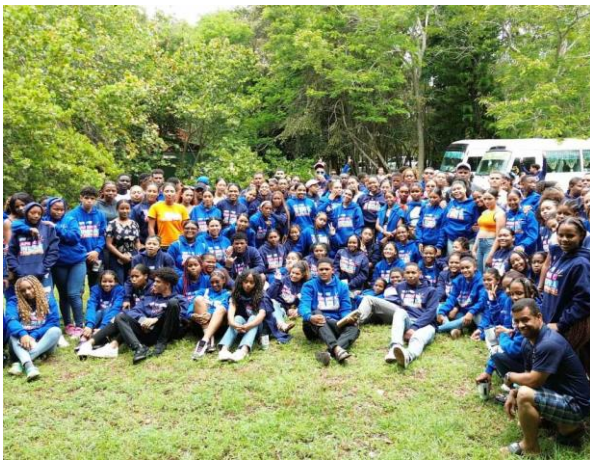
為青少年而設的社會及經濟學習營